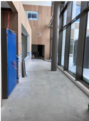
Utsikt mot apoteket sett fra sykehusets hovedinngang