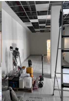
Sykehusekspedisjonen, her plasseres varelagerrobot